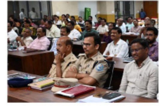
అధికారులు, నబ్బందా అంధం శ్రావణం అలయజిశాం.

ఈ సందర్భంగా పలువురు అధికారులు, సిబ్బంది మాట్లాడుతూ, ఉద్యోగ నిర్వహణలో అదనపు కలెక్టర్ అందించిన ప్రోత్సాహం, ఆయనతో ఉన్న అనుబంధం గుర్తు చేసుకున్నారు.