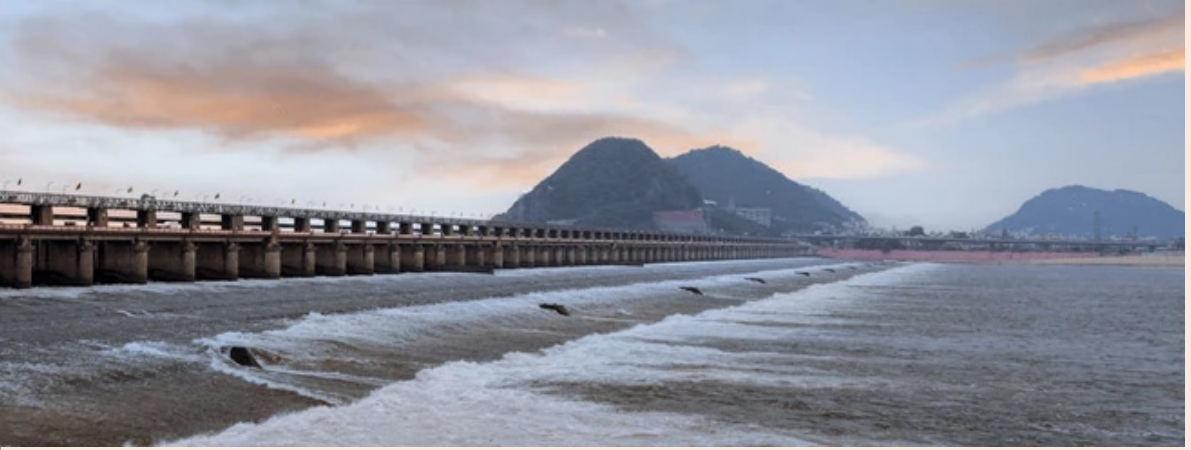
మహబూబ్ నగర్ మార్చి 6

వీకెండ్ లో ఎక్కడికైనా ట్రిప్ ప్లాన్ చేస్తున్నారా.. పరుస సెలవుల్లో మాల్స్ వులు లాంటి ప్రదేశాలకు వెళ్లాలని అనుకుంటున్నారా.. తెలుగు రాష్ట్రాలు దాటి ఎక్కడికి వెళ్లినా ఖర్చుతో కూడుకున్న యాత్ర అవుతుంది. ముఖ్యంగా హైదరాబాద్ లో ఉండే వారు తక్కువ బడ్జెట్ లో మాల్స్ వులను చూసి ఫీలింగ్ పొందడానికి ఓ ఆప్షన్ కరమైన ప్రదేశం ఉంది. అదే తెలంగాణ మినీ మాల్స్ వులు. నాగర్ కర్నూల్ జిల్లాలోని ప్రముఖ పర్యాటక ప్రాంతమైన సోమశిలను తెలంగాణ మినీ మాల్స్ వులుగా పిలుస్తారు. జాతీయ ఉత్తమ గ్రామీణ పర్యాటక ప్రాంతంగా సోమశిలకు అవార్డు కూడా దక్కింది. కృష్ణా నది బ్యాక్ వాటర్స్ అందాలతో ముసాబైన ఈ ప్రాంతం, ఇప్పుడు పర్యాటకులకు మినీ మాల్స్ వులుగా మారిపోయింది. నాగర్ కర్నూల్ జిల్లా పరిధిలోని కొల్లాపూర్ సమీపంలో ఉన్న సోమశిల గ్రామం వద్ద కృష్ణా నది ఒక సముద్రాన్ని తలపిస్తుంది. శ్రీశైలం ద్వారా బ్యాక్ వాటర్స్ ఇక్కడ భారీ జలాశయంగా కనిపిస్తాయి. నల్లమల అటవీ శ్రేణుల మధ్యలో ఈ నీటి ప్రవాహం పర్యాటకులను మంత్రముగ్ధులను చేస్తోంది. నగర జీవన ఒత్తిడి నుంచి ఉపశమనం పొందాలనుకునే వారికి సోమశిల ఒక ఫర్వైడ్ డెస్టినేషన్ అని చెప్పొచ్చు. సోమశిల ప్రాంతాన్ని పర్యాటకులను మంత్రముగ్ధులను చేసేలా తీర్చిదిద్దారు. ఒక్కసారి ఈ ప్రాంతాన్ని సందర్శిస్తే.. మల్లీమల్లీ రావాలనిపించేలా ఈ ప్రాంతంలో ఆప్షన్ కర వాతావరణం ఉంటుంది. తెలంగాణ టూరిజం ఆధ్వర్యంలో అత్యాధునిక వసతులు కల్పించారు. నది తీరాన నిర్మించిన హరిత రిసార్ట్స్ ప్రత్యేక ఆకర్షణగా నిలుస్తున్నాయి.